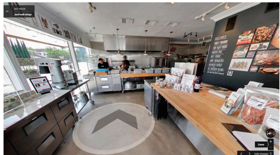
Business View of 'Just Food For Dogs' open kitchen in Newport Beach, California